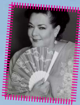
Ella es Delia Casanova.

¿Sabías que en Poza Rica en 1948 nació un bello rostro de las telenovelas de antaño y que sus primeros escenarios teatrales le abrieron las puertas del mundo cinematográfico?